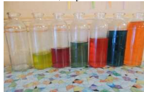
«Чудо – кастаньеты»